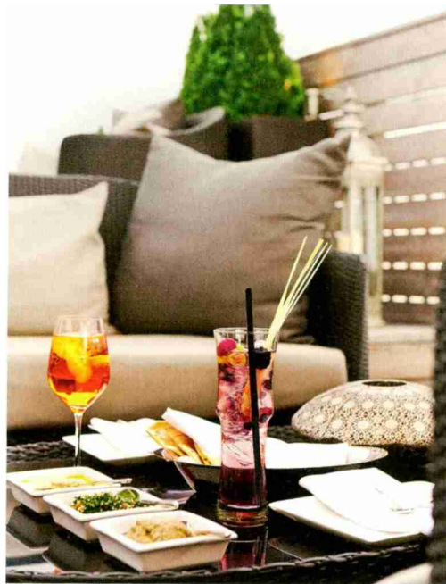
«Apérol Spritz Schweizerhof» mit Apérol, Prosecco, Rose's Lime Cordial und Soda (links) und Lillet Berry mit frischen Beeren, Lillet, Tonic und Grenadine Sirup (rechts).